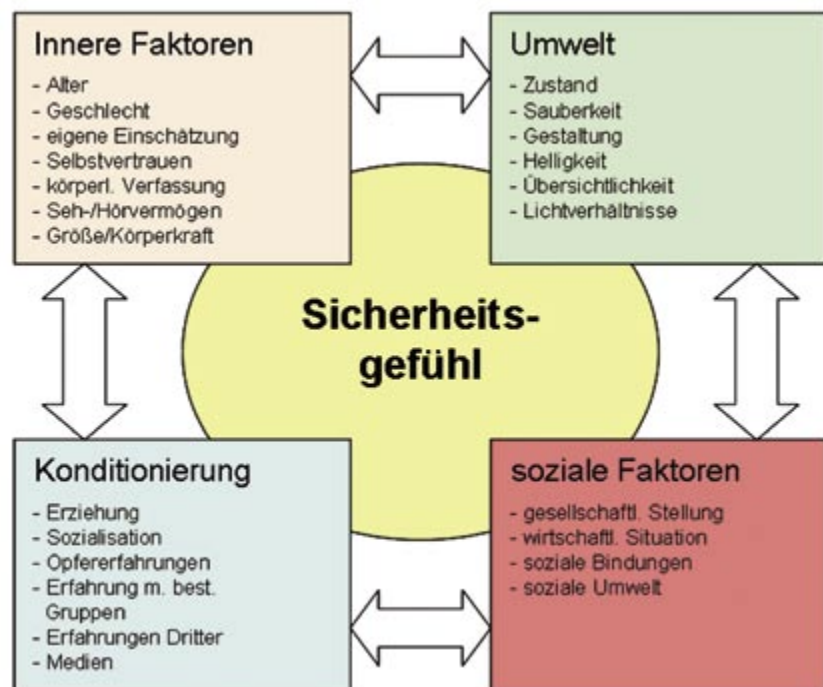
Einflussfaktoren auf das Sicherheitsgefühl

Das so genannte „Sicherheitsgefühl“ ist z.B. in den Medien immer wieder dann ein großes Thema, wenn etwa ein Aufsehen erregendes Kriminaldelikt stattgefunden hat oder entsprechende Gesetze diskutiert werden. Bei genauerer Betrachtung zeigt sich hier oftmals schnell, dass mit diesem Begriff oftmals undifferenziert, manchmal sogar gänzlich falsch umgegangen wird, insbesondere dann, wenn Sicherheit und Sicherheitsgefühl austauschbar oder gleichwertig kommuniziert werden. Die deutliche Unterscheidung dieser Begriffe ist insbesondere im Zusammenhang mit dem Wohnen und der Bewirtschaftung von Wohnraum von Belang. Zunächst ist also zu klären, was genau unter dem Begriff „Sicherheitsgefühl“ zu verstehen ist und welche Abgrenzung zu dem Begriff der „Sicherheit“ vorzunehmen ist.